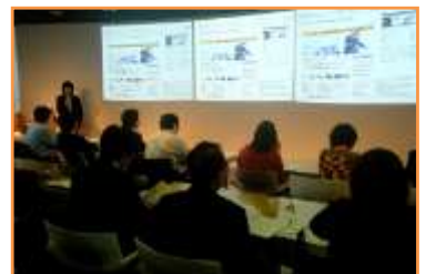
テレワーク・ミニセミナーの様子

遠方の方を対象に、インターネットのライブ中継を予定しています。インターネットでの聴講をご希望の方も、お申し込みをお願いいたします。